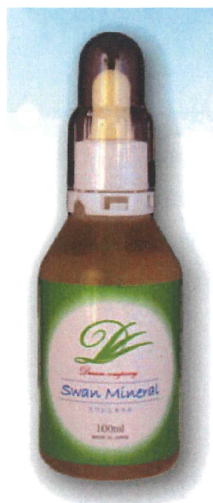
『スワンミネラル(濃縮液)』