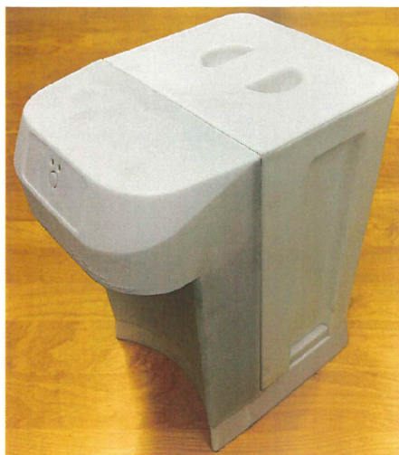
オリジナルの新サーバー『スワンミネラル・スマートサーバー』 ※プロトタイプ

お客様の笑顔が広がれば、ビジネスは成功に近づく ミネラルたっぷりの安心&安全な水を、世界に!