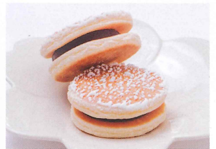
NIPPONすぐれモノ 「じゃんがらミニ」[みよし]