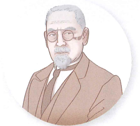
再建者群像 後藤新平