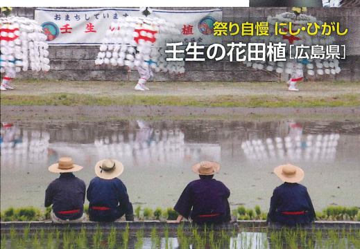
祭り自慢にしひがし 壬生の花田植 [広島県]