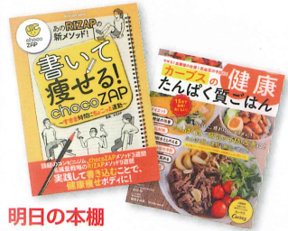
明日の本棚 コンビニジム