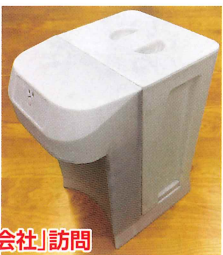
日本の「元気! 会社」訪問 株式会社 ドリームカンパニー